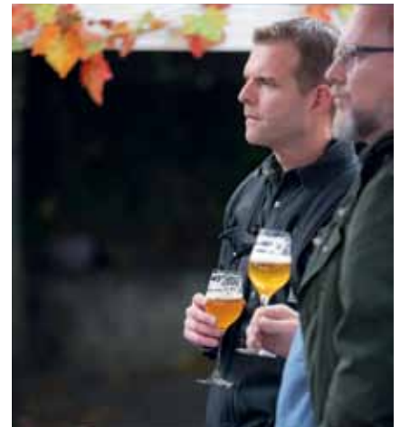
Dva muži s pivem, co víc si přát. Nádherně klidný okamžik