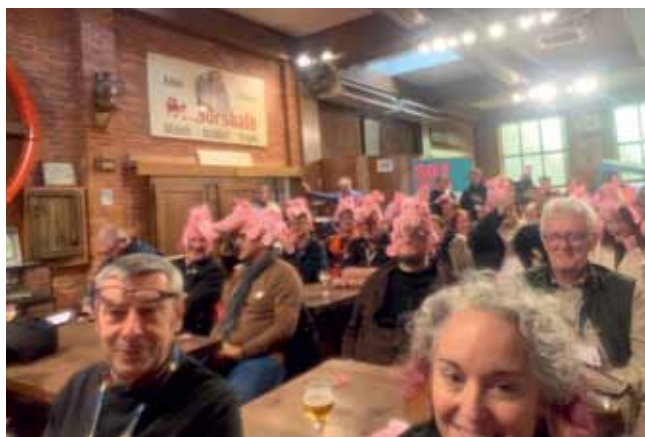
Při návštěvě pivovaru Huyghe je vhodné nasadit na hlavu růžového slona, typického pro značku Delirium Tremens

Libanon, Turecko, Indie, Moldavsko nebo Vietnam. Při hodnocení není počet zlatých, stříbrných a bronzových ocenění limitován vždy třemi, takže se medaile mohou dublovat nebo vůbec nebyť uděleny. Vrstující globalizace způsobila, že některé typicky národní kategorie měly nečekané vítěze – například v kategorii Lager: German-Style Pilsner německého ležáku plzeňského stylu sice zvítězil domácí Kulmbacher Edelherb, ale stříbrnou a dvě bronzové mu již uloupili Italové. Naopak v kategorii italského Grape Ale zvítězil nizozemský pivovar Uiltje Brewing Company, následovaný Brazílií a Moldavskem, až druhý bronz si odnesli Italové. V tomto směru si vedli dobře Češi, kteří letos obsadili kategorii Lager: Bohemian-Style Pilsner důstojně. Zlatou získal Bernard Celebration Lager, stříbro Bernard Bohemian Lager 4.9 a bronz si odvezl kromě Primátoru 11 i belgický Bavik Super z Brouwerij De Brabande. Do kategorie Pale & Amber Ale potom zasáhl Pivovar Louka, když jeho 10° ale Summer Day získal bronzovou medaili po zlatých Italech a stříbrných Irech a Belgičanech.