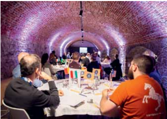
Soutěžní degustace probíhaly v podzemí kláštera.