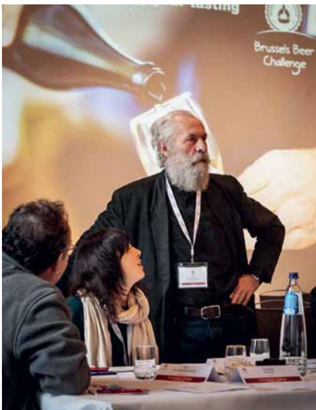
Nejdůležitější je souvislost