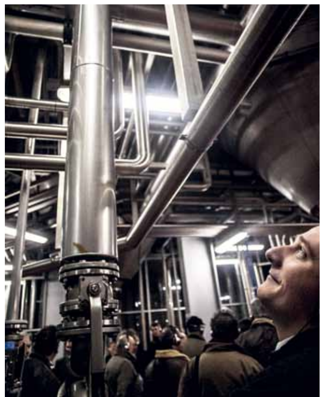
V některých případech je nejkrásnější pohled na pivovar, když zvedneš hlavu.