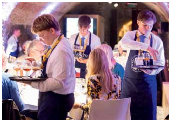
Roznášení vzorků se chopili žáci místní hotelové školy.