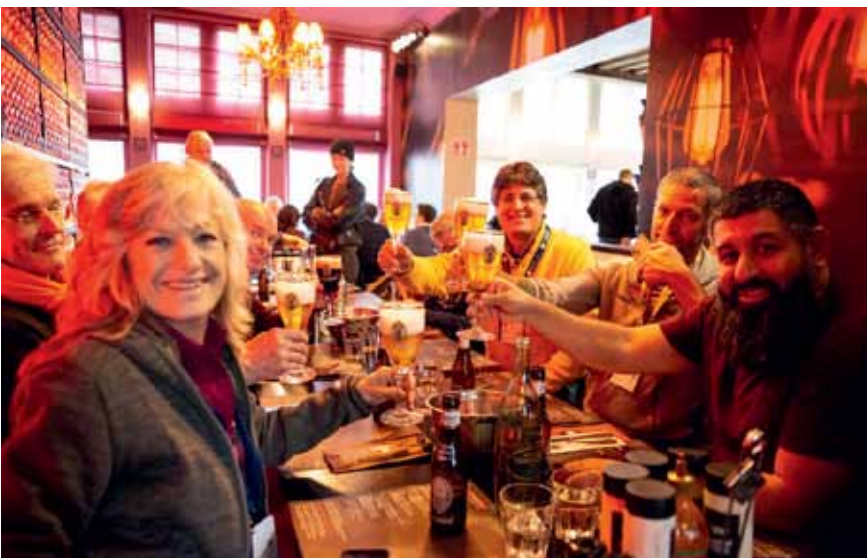
Degustátoři objevovali v Gentu i místní gastronomii.